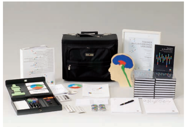
Inhalt des STRUCTOGRAM®-Trainer-Pakets